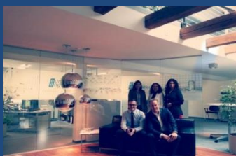
euro-engineering: Top- Arbeitgeber expandiert weiter in der Region