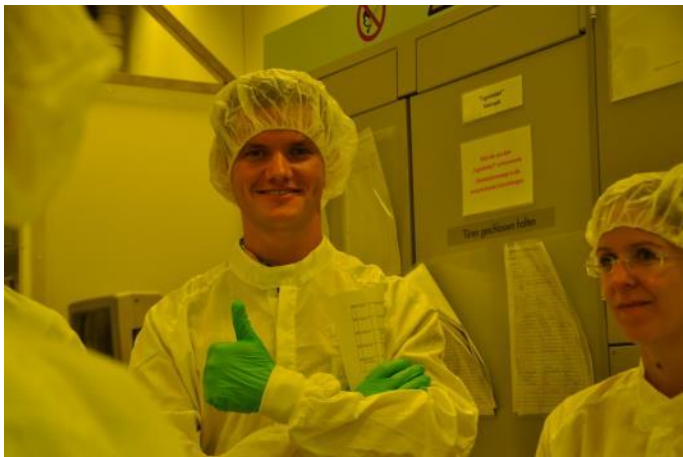
Dieser Teilnehmer empfiehlt die Sensorik-Summerschool auf jeden Fall weiter!

Ein Teilnehmer antwortet auf die Frage: Was fanden Sie an dem Seminar besonders gut? „Alles!“