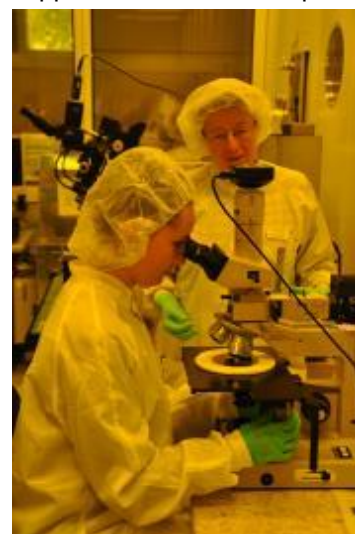
„Hands on“ im Reinraum: Produktion eines Silizium-Wafers

Zudem standen mehrere Unternehmensbesuche auf dem Programm: Die Gruppe besuchte die Captron Electronic GmbH in Olching und erhielt neben Informationen über kapazitive Sensoren und einer Unternehmensführung sogar eine Modell-Flugshow auf dem Firmengelände. Sie zeigte die intelligente Technik von Flybalesssystemen sowie ein neuartiges und revolutionäres Stabilisierungssystem für noch mehr Flugspaß und Sicherheit rund um Modellhelikopter und Modellflugzeuge. Anschließend lernten die Nachwuchskräfte den Standort der Webasto SE in Gilching kennen, dem Produzenten von Dach- und Cabriodach-Systemen sowie Heiz-, Kühl- und Lüftungssystemen, die zur optimalen Funktionalität gespickt sind mit den unterschiedlichsten Sensoren. Die Scherdel-Gruppe in Marktredwitz bot einen hochinteressanten Einblick in die Welt der technischen Federn und führte die Gruppe durch ihr Mess- und Prüfzentrum. Bei Infineon Regensburg erhielten die Teilnehmer einen detaillierten Überblick über Package Technologie und die neuesten Trends und Entwicklungen bei Chip-Gehäusen. Bei der anschließenden Besichtigung einer Fertigungslinie für Seitenairbag-Sensoren konnte die Gruppe dann gleich die High-Tech Umsetzung in der Praxis miterleben. Zudem besichtigten die Nachwuchskräfte den Technologie-Campus an der Ostbayerischen Technischen Hochschule Amberg-Weiden und wurden an der Ostbayerisch Technischen Hochschule Regensburg von Prof. Dr. Hummel nicht nur