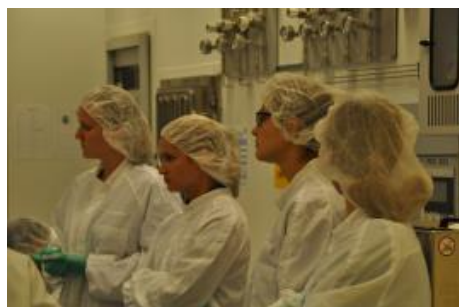
Die Nachwuchskräfte bekommen die einzelnen Prozessschritte im Reinraum erklärt