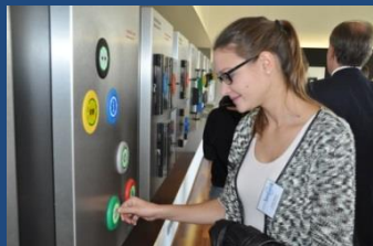
Sensorik Summerschool 2013 – Innovation hautnah erleben