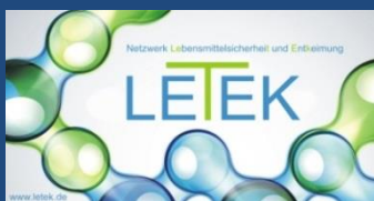
Erstes LETEK- Kooperationsprojekt gestartet