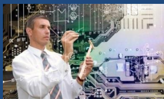
Der „Industrietechnologe“ schließt Lücke zwischen Studium und Lehre