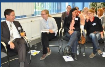
DiaLogisch: Gute Führung und Wertschätzung – ein Rezept für gesunde Mitarbeiter