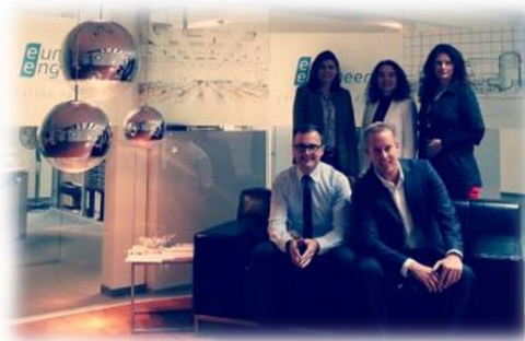
Das Team der euro engineering AG in Regensburg.

Seit dem ersten Juli 2013 ist euro engineering Regensburg neues Mitglied bei der Strategischen Partnerschaft Sensorik e.V. Das Unternehmen beschäftigt am hiesigen Standort 70 Mitarbeiter, die sich schwerpunktmäßig mit den Bereichen Automotive, Elektrotechnik, Anlagenbau und Kommunikationstechnik