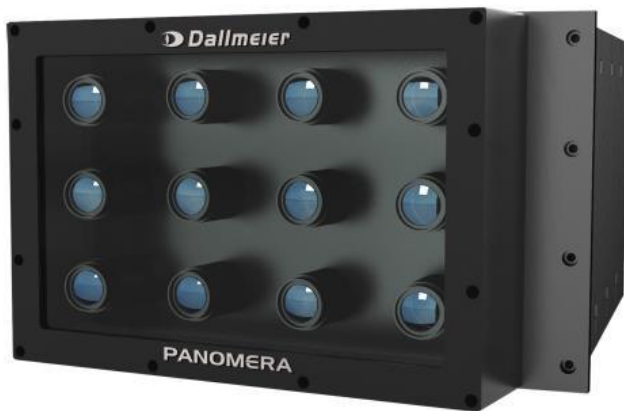
Panomera® ist eine innovative Kameratechnologie, die der Videosicherheitsbranche völlig neue Möglichkeiten eröffnet.

Katastrophen, Extremsituationen mit hohem Menschaufkommen und starkes Gedränge auf beengtem Raum sind ein ausgezeichneter Nährboden für eine „Massenpanik“. Unkontrollierte Angst und massive Fluchtbewegungen gehen mit solchen Umständen einher. Es sind konkret Menschenleben in Gefahr, hohe Kosten entstehen und Schäden an Eigentum sind oft die Folge.