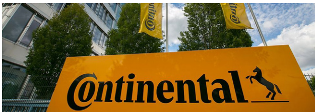
Continental Standort Regensburg.

Regensburg ist einer von weltweit über 300 Continental-Standorten. Für den Unternehmensbereich Vitesco Technologies sowie die beiden Automotive-Divisionen Interior und Chassis & Safety ist Regensburg Forschungs-, Entwicklungs- und Produktionsstandort und fungiert als Sitz von Vitesco Technologies und Interior. Das Unternehmen beschäftigt in Regensburg rund 8.000 Mitarbeiter.