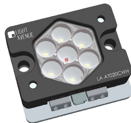
LED Modul Sevengine.

Mit der Sevengine liefert die Light Avenue nun eine Neuheit. Durch die Integration von speziellen Linsen gelingt es, in einer vergleichsweise kleinen Bauform einen engen Abstrahlwinkel zu realisieren und gleichzeitig die Helligkeit extrem hoch zu halten. Der innere und die äußeren LED-Chips sind separat ansteuerbar, so dass auf Kundenwunsch verschiedene LED-, aber auch Detektorchips verbaut werden können. Das neue Modul ist sehr robust und eignet sich neben der Allgemeinbeleuchtung auch für Stadien-, Positions- oder Spezialbeleuchtung. Ferner kann es bei entsprechender Wellenlänge bei Desinfektionsanwendungen oder auch in den Bereichen Horticulture, CCTV und Night Vision zum Einsatz kommen.